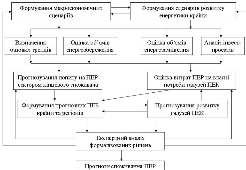
Рис. 2. Схема прогнозування енергоспоживання в країні та в регіонах [17].