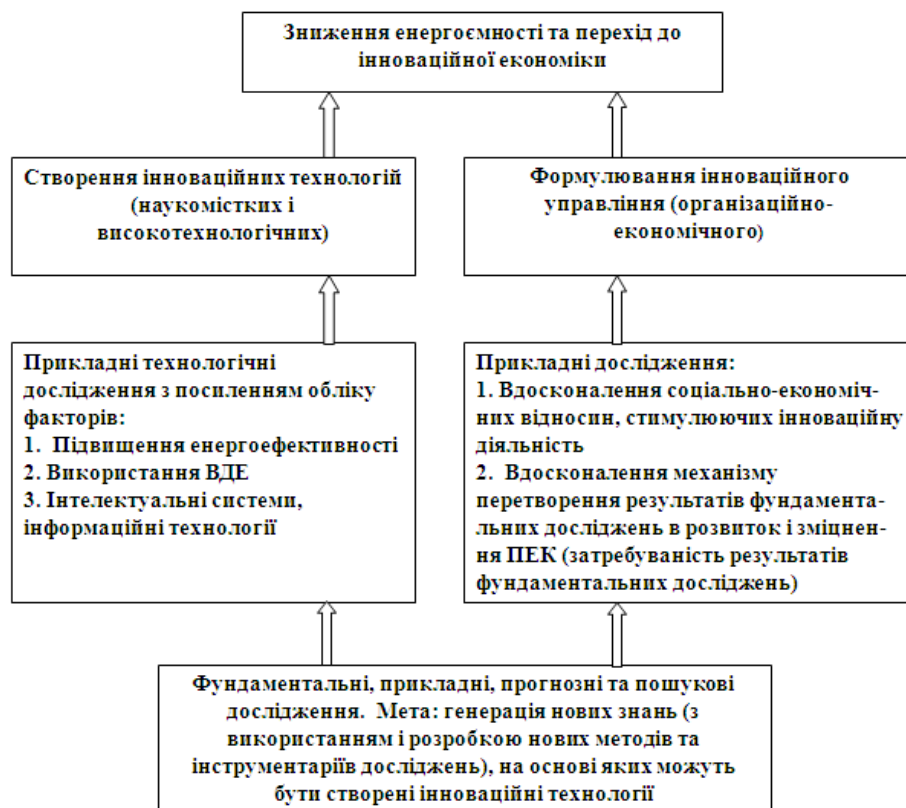
Рис. 2. Від фундаментальних досліджень до інноваційної економіки.

гій і перехід до інноваційної економіки (рис. 2).