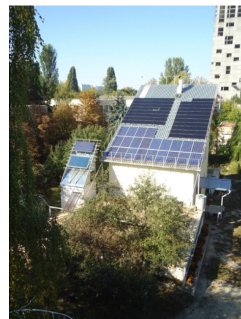
Рис. 1. Експериментальний пасивний будинок типу «нуль-енергій» Інституту технічної теплофізики (з різних ракурсів)