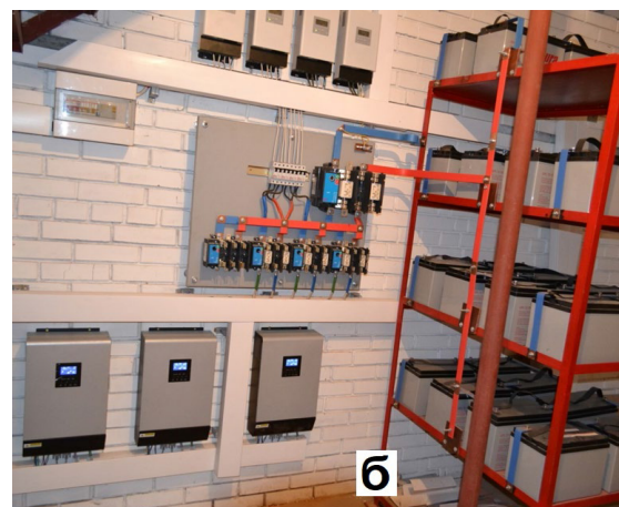
Рис. 2. Фото системи енергозабезпечення експериментального будинку ІТТФ, а – теплонасосної системи теплозабезпечення, б – системи автономного електрозабезпечення