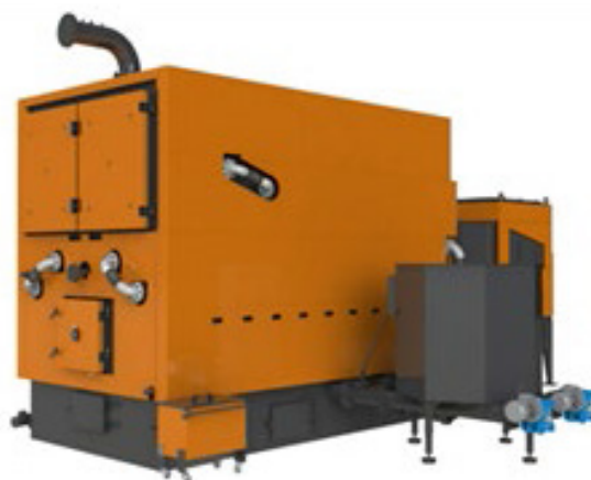
Рис. 2. Котел водогрійний уніфікований КВУ - 0,5Т