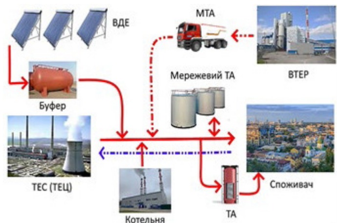
Рис. 3. Інтеграція теплових акумуляторів в систему центрального опалення

При проектуванні нових теплових мереж може бути використана тритрубна система транспорту теплоносія. В цьому випадку по одному з трубопроводів теплоносієм подається споживачеві, а по двох інших повертається. У разі аварії пошкоджений трубопровід відключається, а для опалювання використовуються робочі. Можливий варіант тритрубною системи, коли два трубопроводи подаючі, а один зворотний. З точки зору стабільності гідравлічних режимів і ремонтпридатності тритрубна тепломагістраль доцільніша за двотрубну. Проте капітальні витрати на її будівництво на 30% вище.