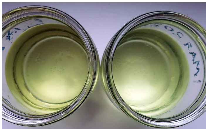
Рис. 5. Спосіб приготування та готовий продукт - теплоакумуляційний рідинний теплоносіє