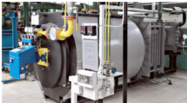
Рис . 1. Котел водогрійний модульний з утилізатором теплоти вихідних газів КВМУ – 1,25Гн