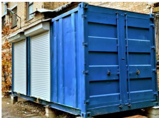
Рис. 4. Мобільний тепловий акумулятор МТА-0,5МВт

Призначення: транспортування, акумуляція, передача та збереження теплової енергії, постачання води та її розчинів. Сфера застосування: теплоенергетика, житлово-комунальне господарство, обора та ліквідація надзвичайних ситуацій. Переваги: залучення промислових відходів теплоти, джерел